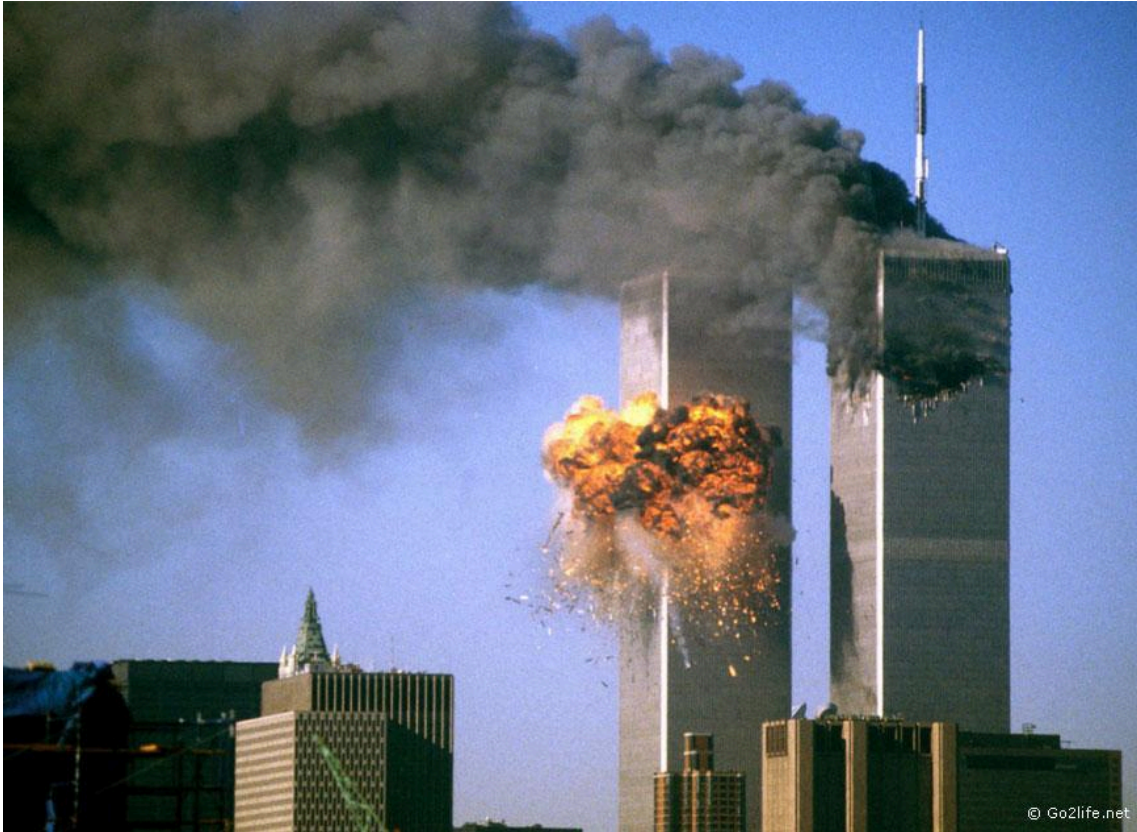
Атака терористів 11 вересня 2001 р. в США

торговельного центру в Нью-Йорку. Того дня загинули майже 3 тис. осіб. Це був найбільший теракт в історії Сполучених Штатів. США звинуватили в терористичних атаках міжнародну ісламістську організацію «Аль-Каїда» і персонально її лідера — саудівського мільйонера Усаму бен Ладена .