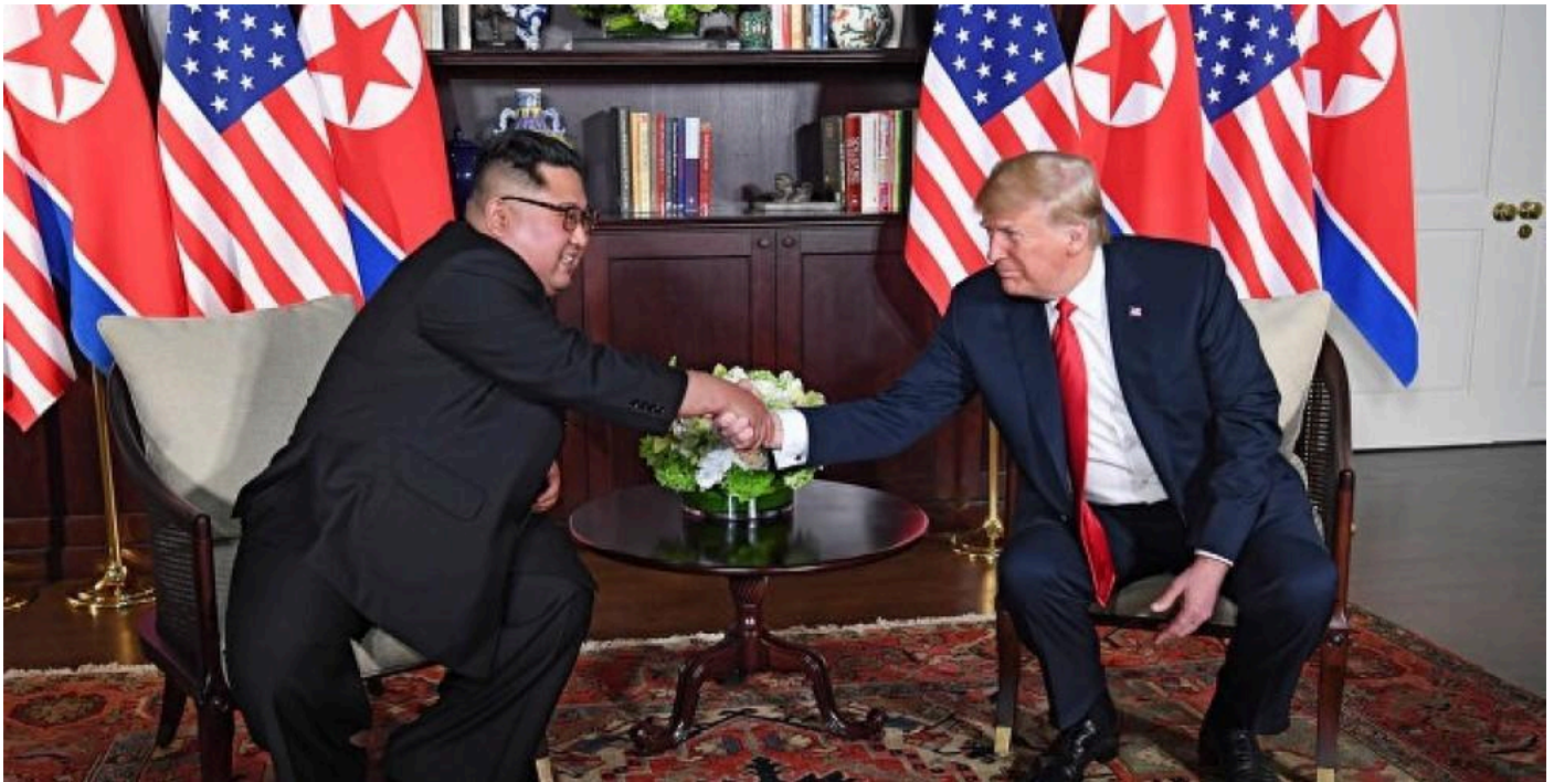
Д. Трамп і Кім Чен Ин. Офіційна зустріч у Сингапурі. 2018 р.

Після зустрічі між країнами продовжилися складні дипломатичні переговори з метою ліквідації всієї ядерної зброї на Корейському півострові.