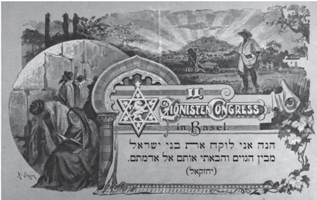
כרטיס נציג בקונגרס הציוני השני