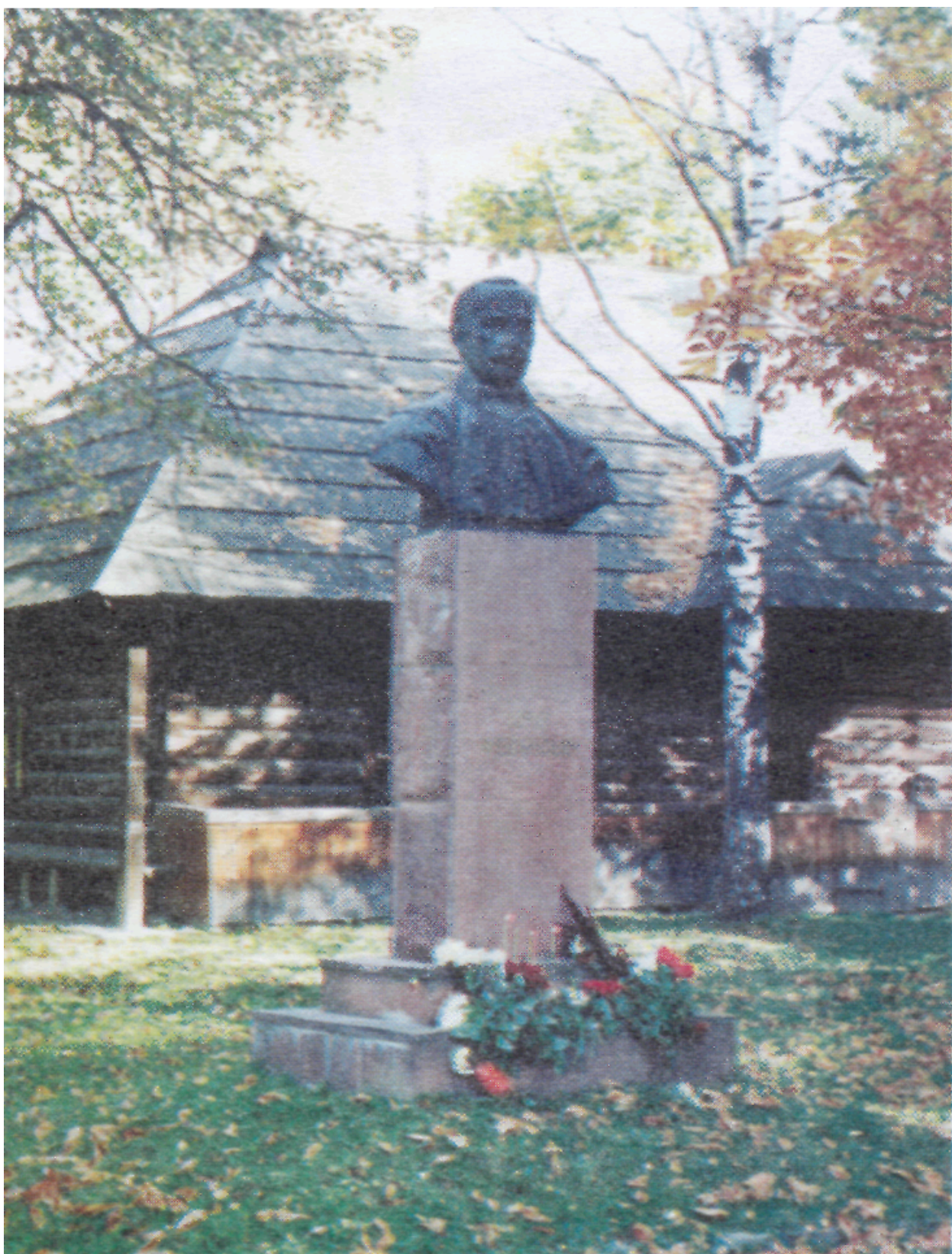
Пам'ятник Ю. Федьковичу на його родинному подвір'ї, споруджений 1984 року.