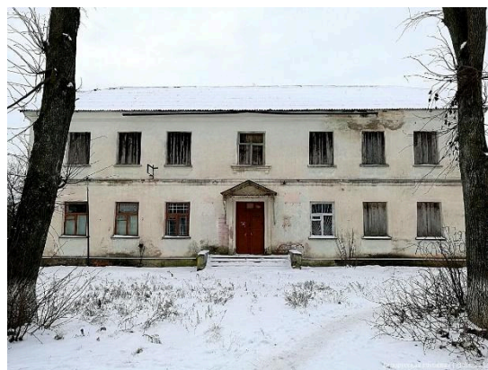
Бывшее заводоуправление «Красного Знамени» п. Черницкий, Плииский сельсовет