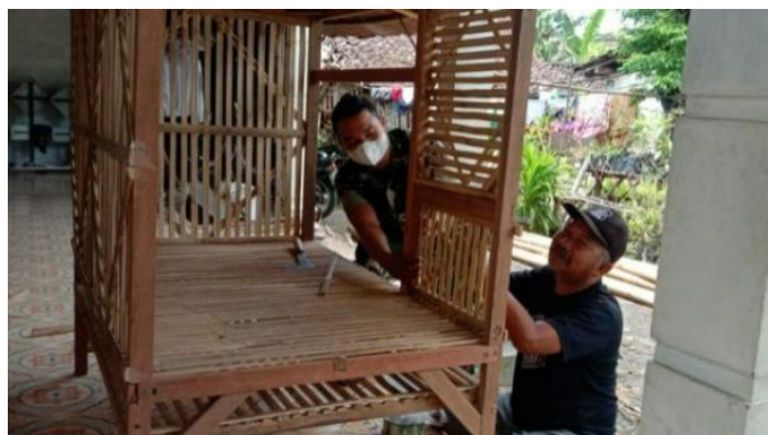
Gambar 1. Proses Pembuatan Rangka Kandang