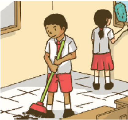
Gambar 2.8 Sekelompok peserta didik yang sedang membersihkan kelas.