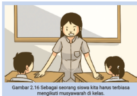
Gambar 2.16 Sebagai seorang siswa kita harus terbiasa mengikuti musyawarah di kelas.

“Bagaimana kalau kita ke hutan lindung lagi, Bu?”