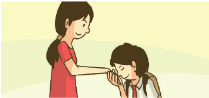
Gambar 2.2 Seorang anak pamit kepada orang tuanya