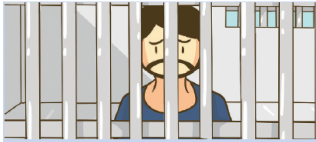
Gambar 2.4 Hukuman penjara merupakan salah satu sanksi bagi para pelanggar norma hukum.

menjadi harmonis, saling menghormati, saling menghargai, dan tolong menolong antarsesama.