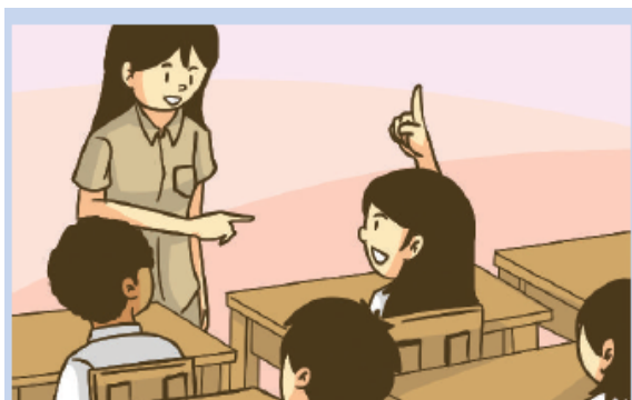
Gambar 2.10 Sebagai seorang peserta didik setiap anak berhak mengajukan pertanyaan kepada guru.