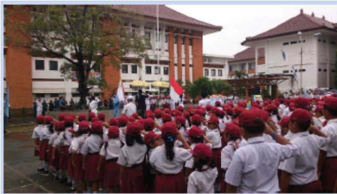
Gambar 2.13 Salah satu kewajiban anak di sekolah adalah mengikuti upacara bendera