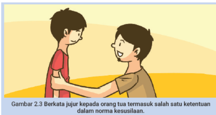
Gambar 2.3 Berkata jujur kepada orang tua termasuk salah satu ketentuan dalam norma kesusilaan.

Norma kesopanan, yaitu ketentuan dalam kehidupan manusia yang timbul dari hasil pergaulan manusia di dalam masyarakat. Sanksi terhadap pelanggaran norma kesopanan sifatnya tidak tegas, tapi dapat diberikan oleh masyarakat dalam bentuk celaan, cemoohan, atau pengucilan dalam pergaulan. Contoh norma kesopanan, seperti kewajiban untuk menghormati orang tua, tidak menyinggung perasaan orang tua, mematuhi nasihat orang tua, dan sebagainya. Anak yang tidak hormat kepada orang tuanya, ia akan dikucilkan oleh orang tuanya, saudaranya ataupun oleh anggota masyarakat lainnya.