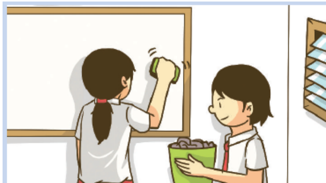
Gambar 2.11 Setiap anak selain mempunyai hak juga mempunyai kewajiban yang harus dilaksanakan.