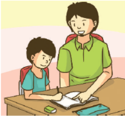
Gambar 2.7 Orang tua yang sedang membimbing anaknya belajar di rumah.

Ceritakan dua gambar berikut ini di depan kelas