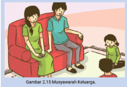
Gambar 2.15 Musyawarah Keluarga.

“Bagaimana kalau kita pergi ke kebun binatang, Yah?” usul Kak Rudi.