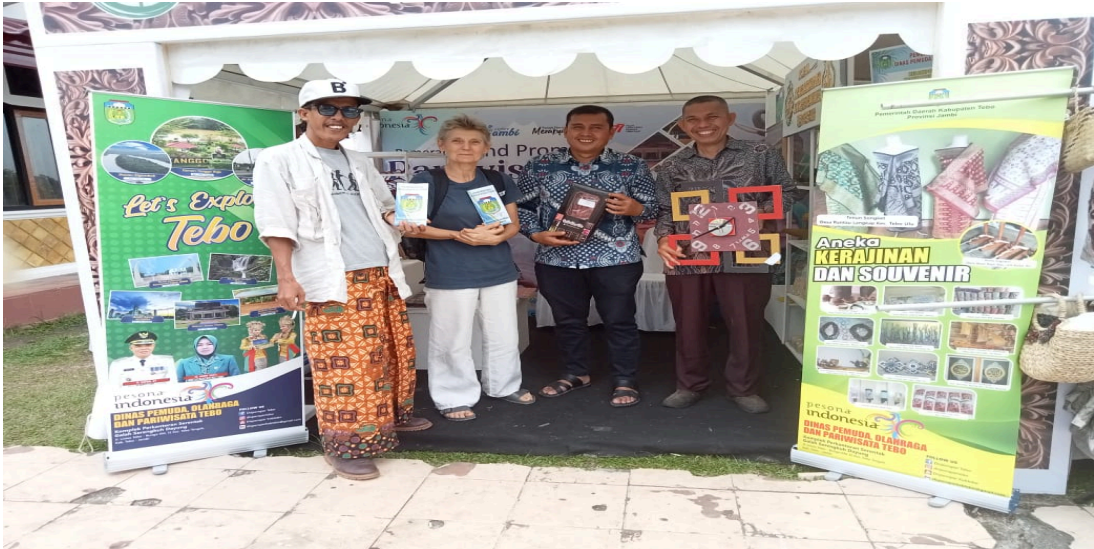
FOTO KEGIATAN BIDANG OLAHRAGA