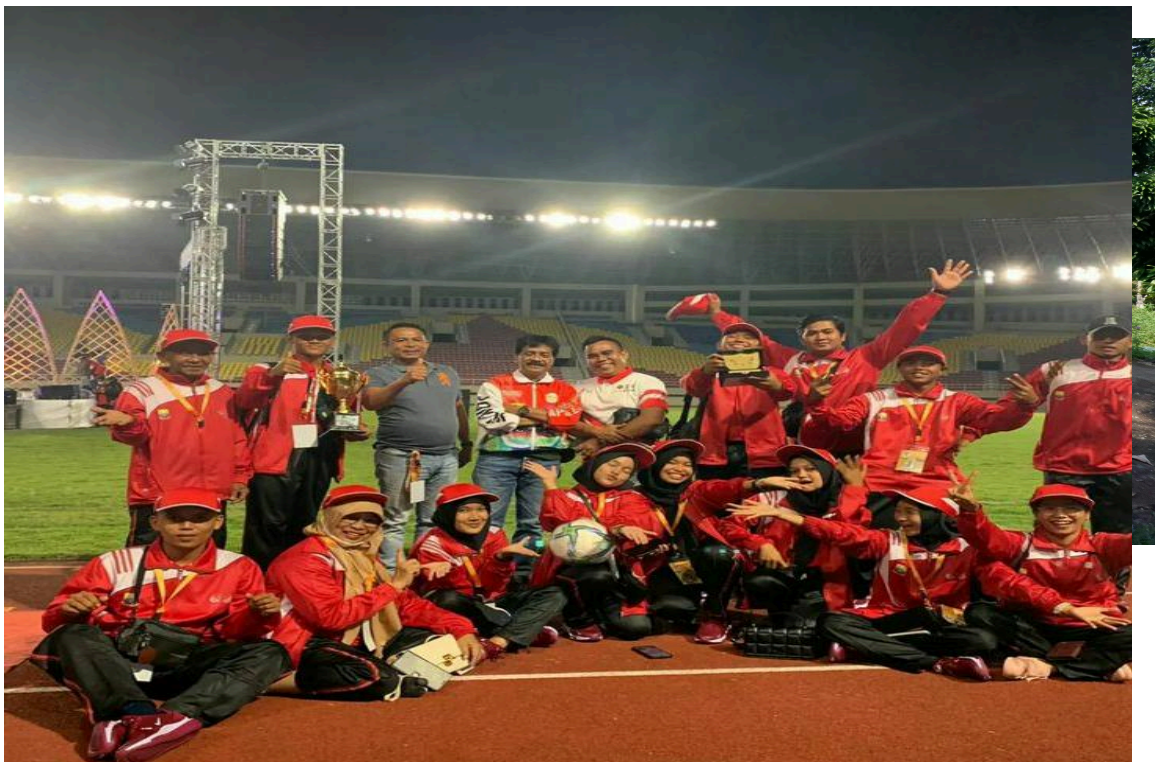
PELEPASAN OLAHRAGA TRADISIONAL TINGKAT PROVINSI JAMBI(TEBO MENDAPATKAN JUARA 1)