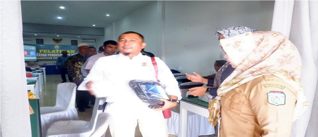
FOTO KEGIATAN PELATIHAN KEMITRAAN