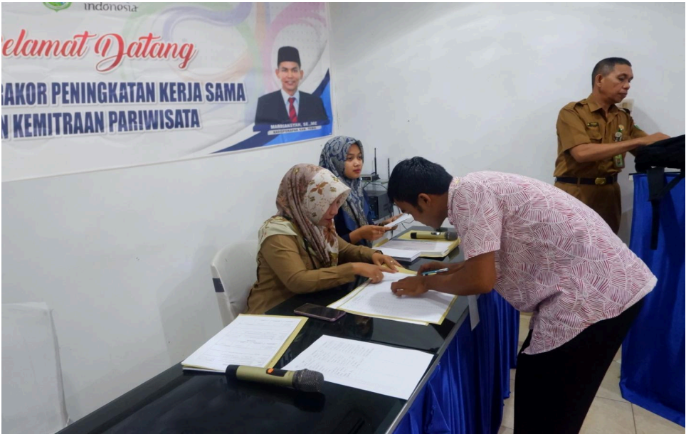
FOTO MONITORING DAN EVALUASI BIDANG PARIWISATA TAHUN 2022