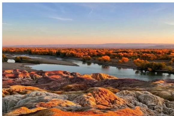
Bãi Ngũ Sắc