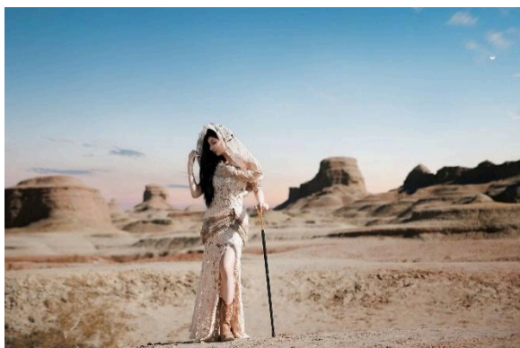
Thành phố quý trên Biển