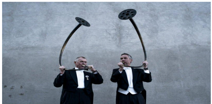
EL LUR NORDICO INSTRUMENTO DE GUERRA