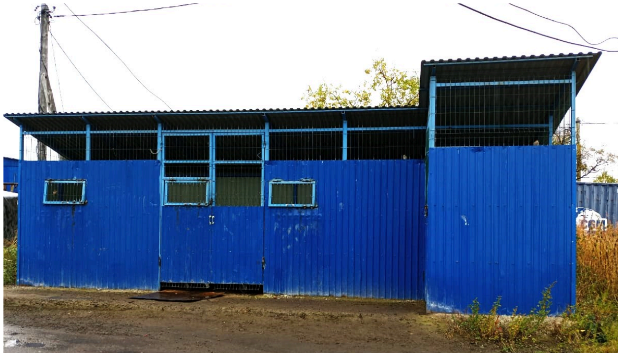
Фото 3. с. Тилички. Площадка для сбора отходов, защищенная от доступа животных

На самом деле, у контролирующих органов, которых у нас великое множество, имеется набор механизмов воздействия на нарушителей. Например, в соответствии статьей 60.12 Лесного Кодекса Российской Федерации или со статьей 13 Земельного Кодекса и так далее. Ведь загрязнение пищевыми и бытовыми отходами представляет опасность для жизни и здоровья человека, поскольку привлекают медведей.