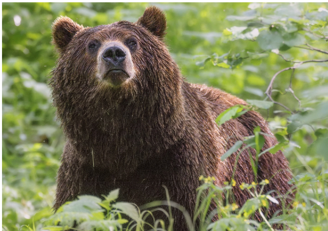
Фото 1. Сегодня необходимо принять нулевую ставку сбора за пользование медведем

Первое. Необходимо увеличить промысловое изъятие медведей с целью стабилизации или снижения численности популяции. Для этого уровень официальной добычи должен составить 2000 – 2400 особей.