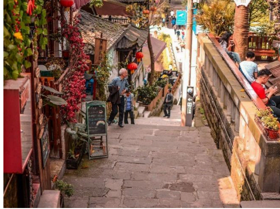
Tì Khí Khẩu

Đoàn dùng bữa sáng tại nhà hàng khách sạn. Sau bữa sáng đoàn tham quan: