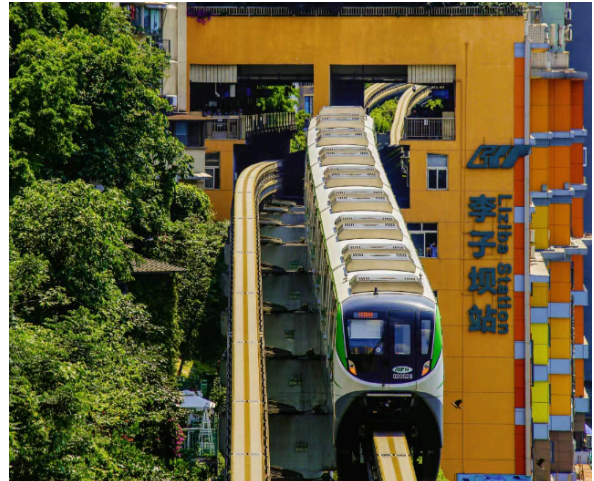
Ga tàu Lí Tử Bá ( Liziba )

Đoàn dùng bữa sáng tại nhà hàng khách sạn, làm thủ tục trả phòng.