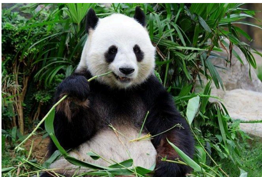
Công viên Gấu trúc Trùng Khánh