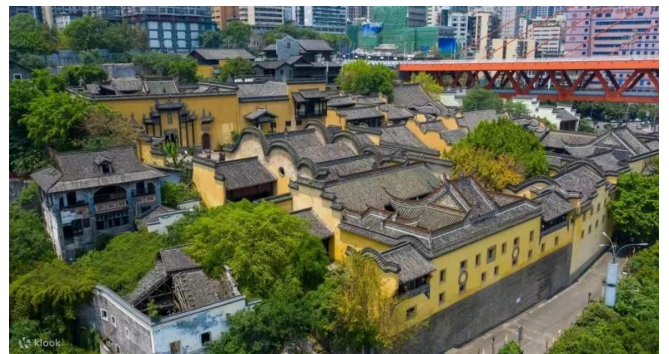
Hội Quán Hồ Quảng

Đoàn dùng bữa sáng tại nhà hàng khách sạn. Sau bữa sáng đoàn tham quan: