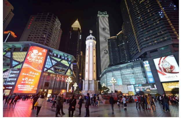
Tượng đài Giải phóng Nhân dân