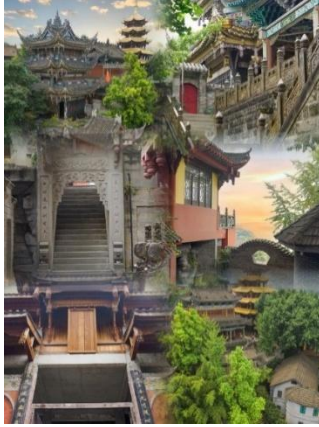
Chùa Bảo Luân