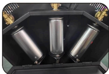
3. alinear la boca de la botella de aceite de pulverización con la interfaz de la máquina