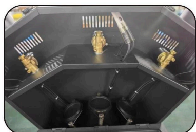
1. abra la hebilla de la máquina