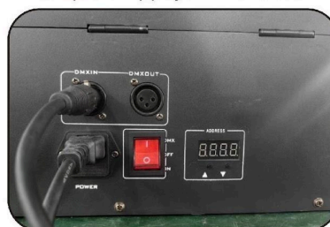
4. Branchez le cordon d'alimentation, allumez l'interrupteur et connectez le contrôle DMX.