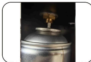
2. Placez l'huile de pulvérisation dans le disque et appuyez vers le bas.