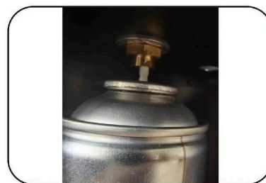
2. Place the spray oil into the disc and press it down.