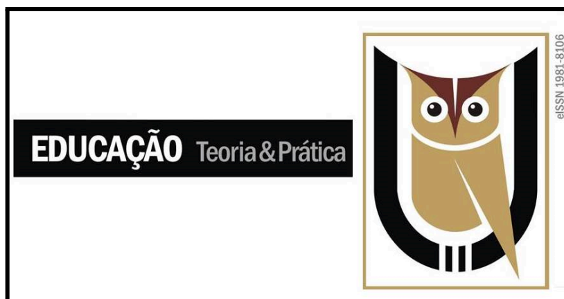
Figura 1 – Título da figura em fonte de tamanho 12, espaçamento simples.

Fonte: A figura deve ser centralizada, com fonte embaixo tamanho 10 e espaçamento simples.