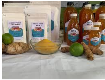
Gambar 1. Ecovitrap dalam rumah