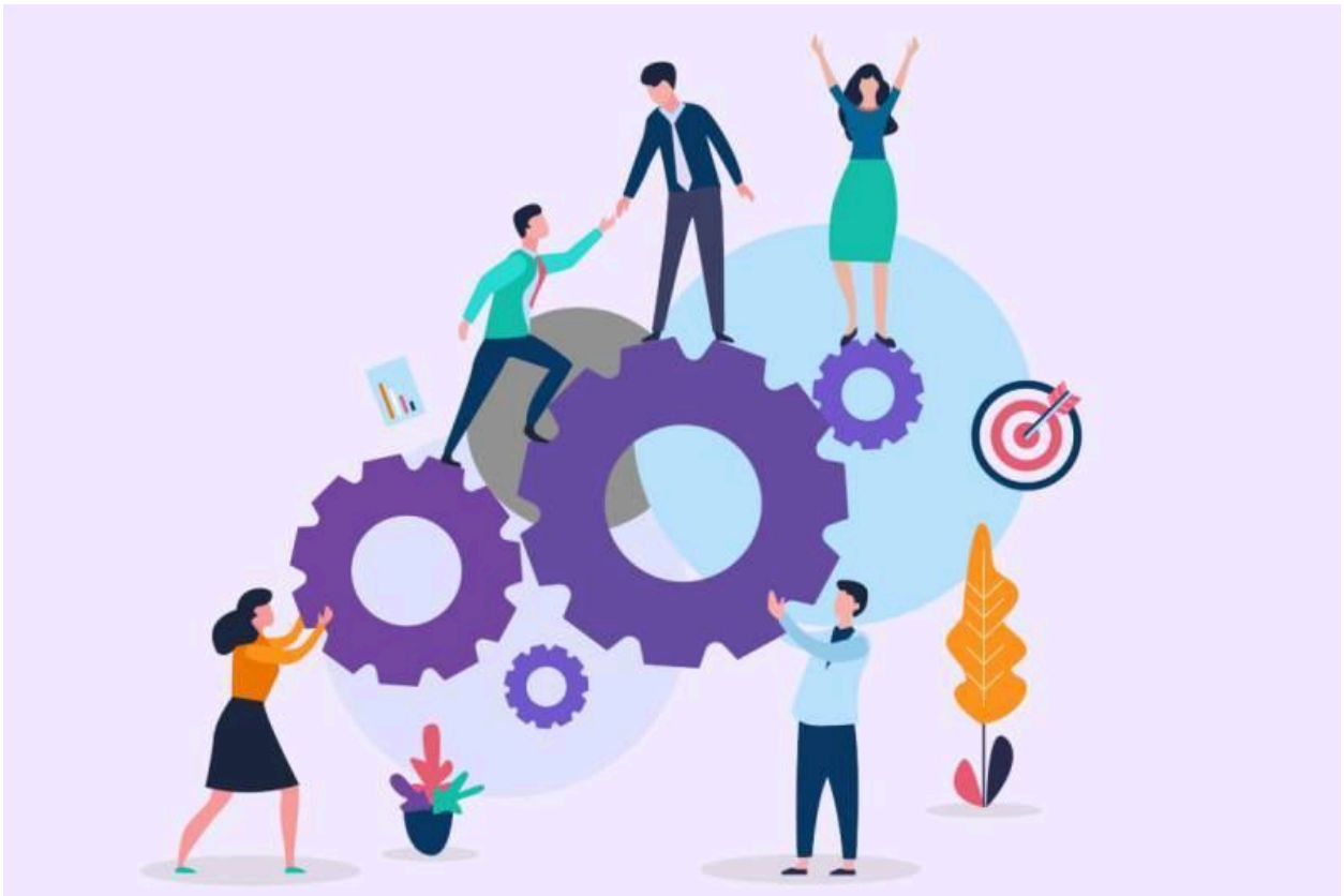
Imagen inicio de sesión