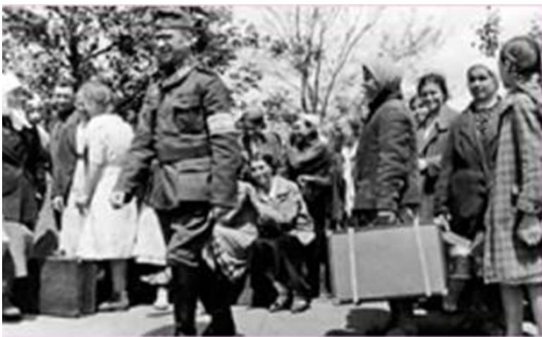
Фото. Остарбайтери перед виїздом до Німеччини