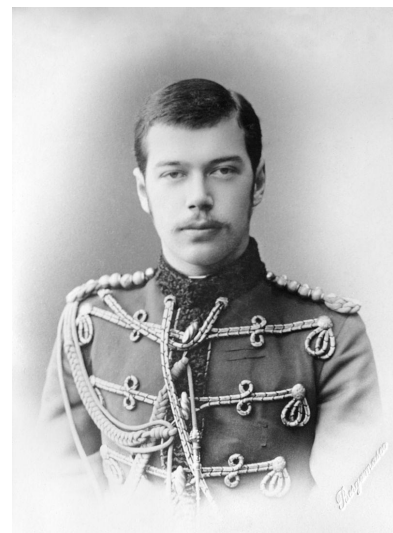
Цесаревич Николай Александрович. 1889 год.

В Енисейской губернии Николай находился с 28 июня по 3 июля 1891 г. Особы царской крови крайне редко удостаивали Сибирь своими визитами, и потому неудивительно, что событие вызвало живейший интерес всех слоев общества и надолго осталось в памяти горожан. К встрече цесаревича долго и тщательно готовились, его приезду была посвящена грандиозная программа. По свидетельству «Енисейских губернских ведомостей» от 14 сентября 1891 года, «на всем протяжении следования Его Высочества города и села принимали обновленный вид: всюду красились и подновлялись дома, починялись дороги, строились и ремонтировались мосты, воздвигались триумфальные арки и все здания стали украшаться флагами и зеленью. Губернская администрация приняла все меры к предоставлению Его Высочеству удобного путешествия: повсюду на местах остановок были назначены команды из благонадежных чиновников, чтобы предупредить малейшие неудобства при проезде Его Высочества».