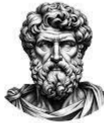
Zenon de Citio