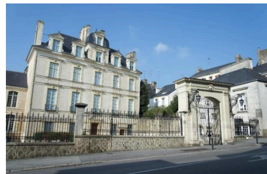
Hôtel de Limur