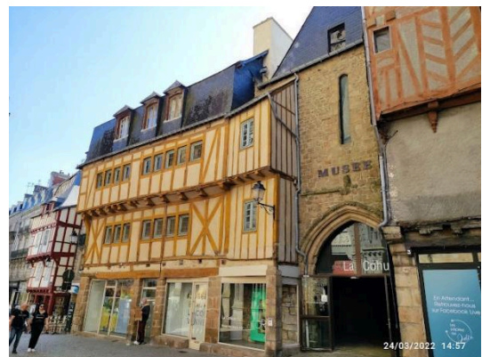
L'entrée de la Cohue

Au fur et à mesure que l'heure passe il y a de plus en plus de monde dans les rues. Nous ne savons plus si nous devons regarder les passants qui arborent leurs premières tenues estivales, les terrasses, les vitrines des magasins... ou les ouvriers qui s'affairent sur les différents chantiers de restauration. Le petit train avance parfois à grand peine.