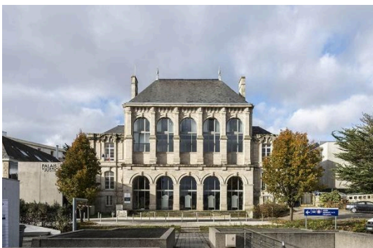
Palais de Justice,

Toujours à gauche, un bel hôtel particulier classé Monument Historique en 1993, conserve le nom de la famille de Limur qui en fut propriétaire de 1820 à 1947. Il est maintenant le siège du Centre d'Interprétation de l'Architecture et du Patrimoine (CIAP), nommé en mai 2022.