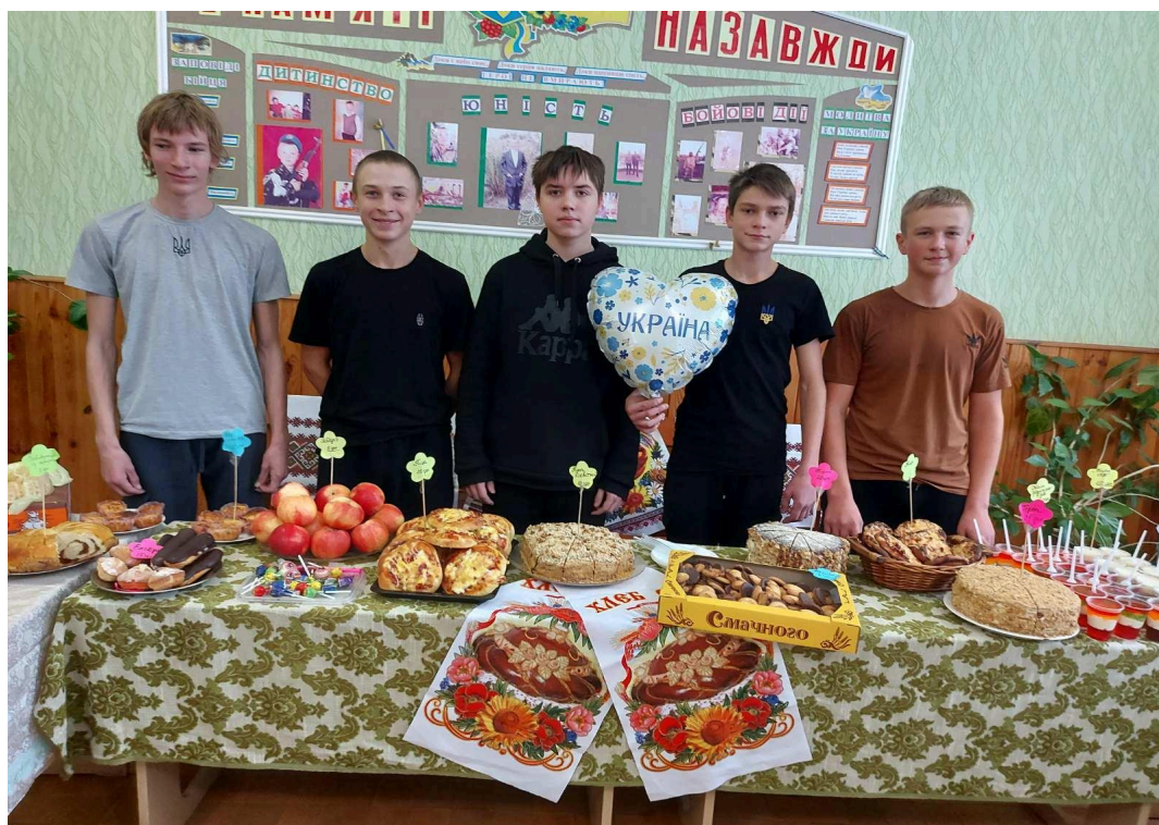
Участь в радіодиктанті національної єдності