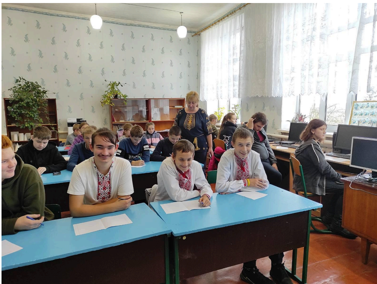
Вшануємо пам'ять жертв голодомору