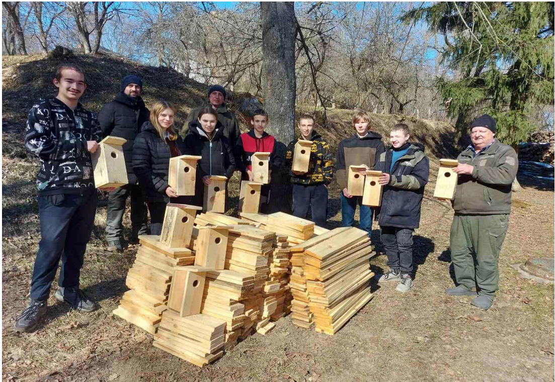
Акція «Посади дерево»