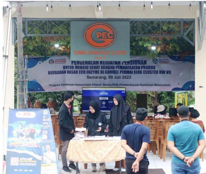
Gambar 1. Penyuluhan tentang manfaat Produk Eco