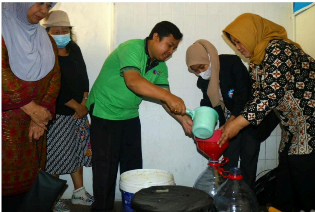
Gambar 3. Pembelajaran Bersama Pembuatan Granul bersama Warga

Pada gambar 3 adalah kegiatan pembuatan granul dari bahan echo enzyme bersama warga, dari tahap ini bahan limbah sampah rumah tangga di olah menjadi pupuk yang bisa di manfaat kan di lingkungan sehingga akan mengurangi limbah di masyarakat. Pada kegiatan ini di lakukan pendampingan untuk membuat granul dari awal pencacahan limbah sampai penyaringan dan menjadi granul setengah jadi.