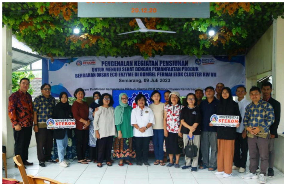
Gambar 2. Foto bersama Peserta Pengenalan Manfaat Produk Berbahan dasar Echo Enzyme