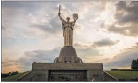
Монумент «Батьківщина-Мати». Національний музей історії України у Другій світовій війні. Київ