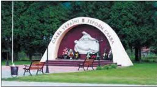
Пам'ятник героям УПА. Сколе (Львівська обл.)

Серед уроків, які надала людству Друга світова війна, доцільно звернути увагу на такі: