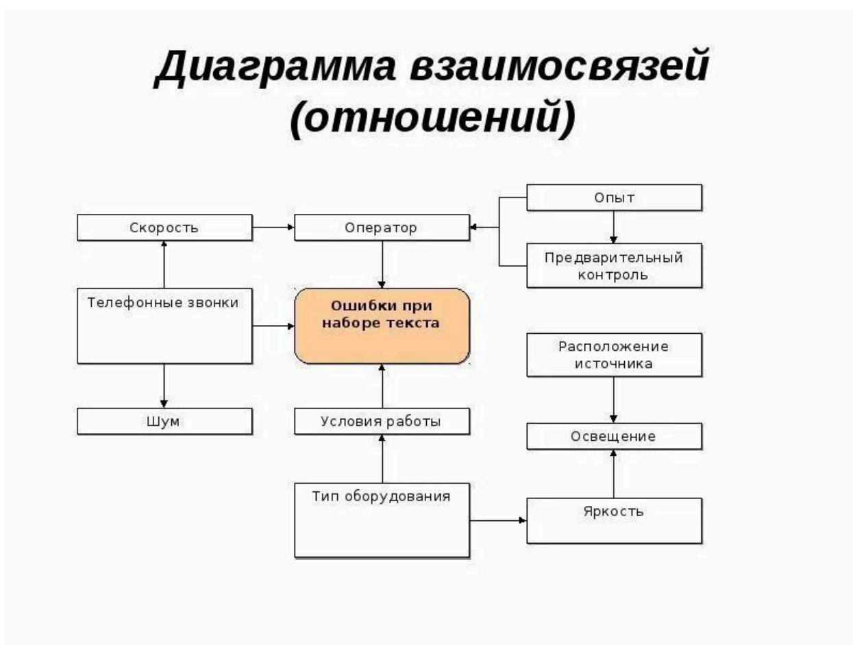
Рисунок 1 – Диаграмма взаимосвязей (отношений)

В целом, конечно, постоянное информационно-пропагандистское обеспечение нашей деятельности однозначно фиксирует необходимость распределения внутренних резервов и ресурсов. Имеется спорная точка зрения, гласящая примерно следующее: тщательные исследования конкурентов призваны к ответу. Результаты представлены на рисунке 1.