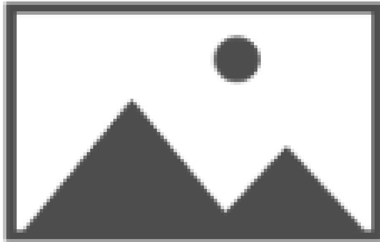
Gambar 2 Asisten menjelaskan langkah kerja kepada kelompok Y

[Berikan narasi tentang gambar diatas, misal dengan melakukan kegiatan apa/ sedang menggunakan alat apa )