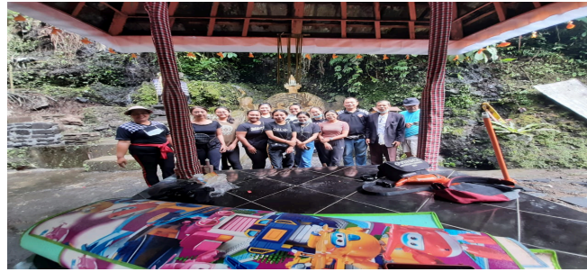
Gambar 1. Gotong royong