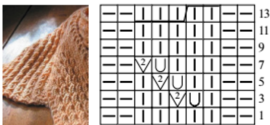
Рис. 7.16. Вязание шарфа узором «Колоски»

2 уровень (посложнее) - выполнить вариант 3 узор «колосок»