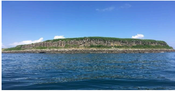
桶盤嶼的玄武岩柱

桶盤嶼是澎湖群島中 玄武岩柱體 最大且最具規模的島，玄武岩因風化差異侵蝕的作用，形成 蜂巢狀 的孔洞，當地人稱為「貓公石」，曾為雅石愛好者的最愛，現已明令禁採。桶盤全由 玄武岩 紋理分明的 石柱 羅列環抱而成，柱狀節理之盛，尤居澎湖之最。玄武岩石柱形成的陡峭海崖。但因 颱風 肆虐，玄武岩石柱有幾處已坍塌。每一岩柱高約20公尺，寬約1.5公尺，顏色因氧化變成淺棕色，頂部則風化成球狀構造，所以有海上 黃石公園 的美譽，是 澎湖玄武岩自然保留區 的一部份，台灣也正積極的向聯合國申請將桶盤玄武岩列為 世界遺產 。澎湖桶盤地質公園成立於2008年1月3日。現行 中華民國護照 註記頁(第48、49頁)即為桶盤嶼之照片。