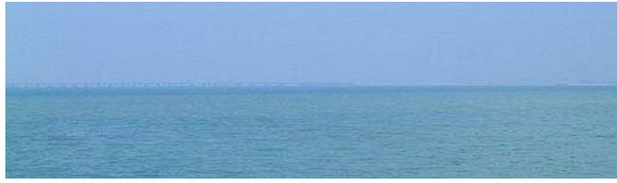
從島上眺望跨海大橋