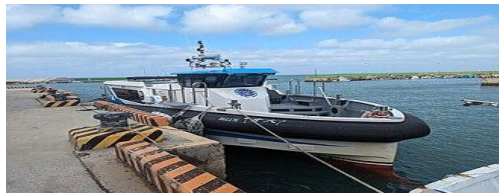
開往大倉嶼的交通船