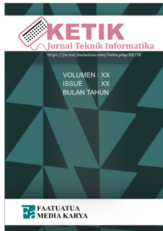
Gambar 1. Gunakan gambar yang berkualitas baik

Sedangkan penulisan gambar, keterangan gambar berada di bawah dari gambarnya. Gambar ditampilkan dalam posisi rata tengah. Untuk lebih jelasnya, lihat gambar 1 di bawah ini. Agar setiap gambar yang ada di dalam artikel terurut, gunakanlah style yang sama dengan nama DaftarGambar ketika memberi keterangan gambar.