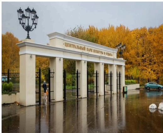
Фото №1 Центральный парк культуры и отдыха