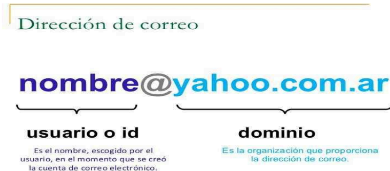
Figura 1. Características del correo electrónico (Equipo de redacción PartesDel.com, 2017)

El correo electrónico (correo electrónico) es el intercambio de mensajes almacenados por computadora por telecomunicaciones. (Algunas publicaciones lo deletrean email; preferimos la ortografía actualmente más establecida del correo electrónico.) (Rouse, 2005)