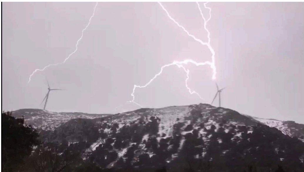
ΑΣΠΗΕ Περγαντή (Ακαρνανικά όρη)