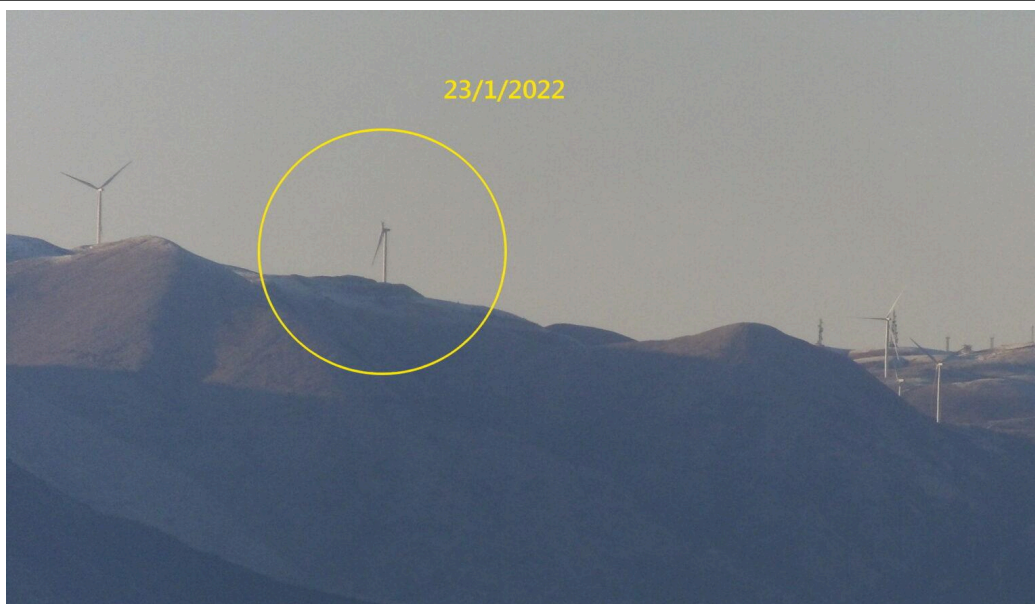
Κατεστραμμένο πτερύγιο στον ΑΣΠΗΕ Περγαντή (Ακαρνανικά όρη)