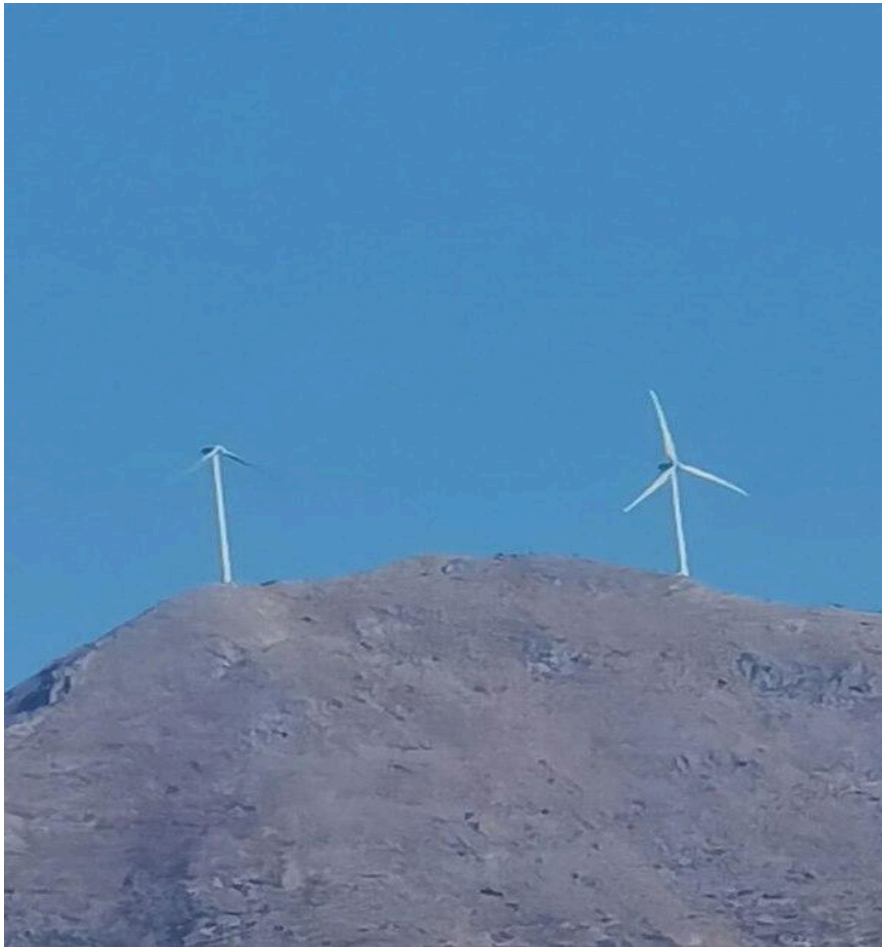
Η μία (1) από τις δύο (2) ανεμογεννήτριες στην κορυφή της Κλόκοβας Αιπ/νίας, χωρίς πτερύγιο (2020)