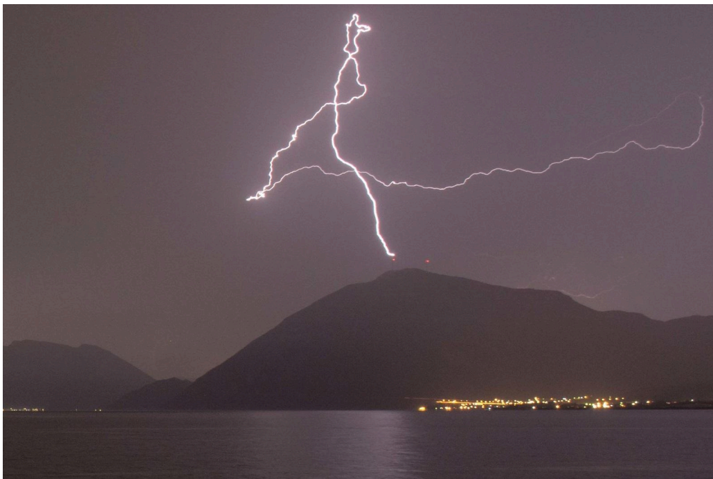
Οι δύο (2) ανεμογεννήτριες στην κορυφή της Κλόκοβας Αιτ/νίας (2018)

Παρόλα αυτά, αρκετά είναι τα περιστατικά καταστροφής πτερυγίων ανεμογεννητριών από κεραυνούς σε υπερσύγχρονους ΑΣΠΗΕ, οι οποίοι είναι εγκατεστημένοι σε βουνά της Αιτωλοακαρνανίας (εύκολα μπορεί να αναζητηθούν πληροφορίες για το κάθε ένα από αυτά στο διαδίκτυο): ΑΣΠΗΕ Γάβροβο/Χιονάκι στα όρη Βάλτου (Ιούνιος 2022), ΑΣΠΗΕ στα όρη Ακαρνανικά (Ιανουάριος 2022), ΑΣΠΗΕ στην Παλιοβούνα (Κλόκοβα) Αντιρρίου (Αύγουστος 2020), ΑΣΠΗΕ στην περιοχή Παλιόσκαλα Ναυπακτίας (Απρίλιος 2020) και ΑΣΠΗΕ Γάβροβο/Χιονάκι στα όρη Βάλτου (Ιούνιος 2018). Τέτοια περιστατικά φανερώνουν την ανικανότητα της αντικεραυνικής προστασίας των ανεμογεννητριών από την μανία της φύσης, ειδικά σε τέτοια υψόμετρα, την επικινδυνότητα των ανεμογεννητριών προς τον άνθρωπο και την άγρια ζωή και την αφερέγγυότητα τους ως προς την σωστή, ασφαλή και συνεχή λειτουργία τους.