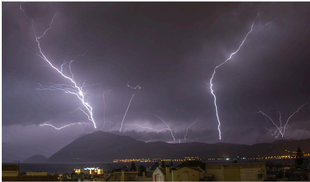
Περιοχή Κλόκοβας-Αντιρρίου Αιτλίας: διάσπαρτες ανεμογεννήτριες και κεραυνοί (Ιαν. 2023)