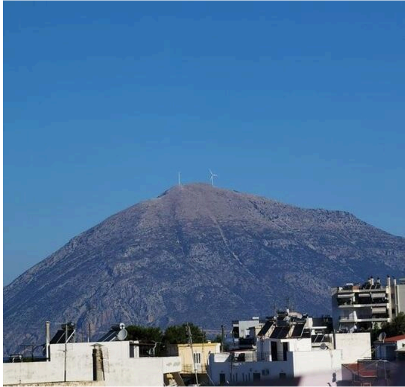
Η μία (1) από τις δύο (2) ανεμογεννήτριες στην κορυφή της Κλόκοβας Αιπ/νίας, χωρίς πτερύγιο (2020)