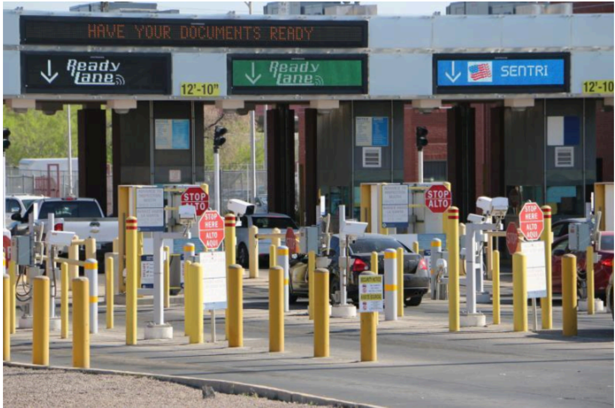
美国公民/绿卡/双程证(BCC)专用快速通道—Ready Lane