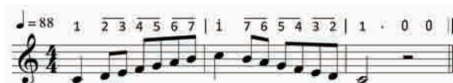
Latihan 10. Vokalisi Arpeggio