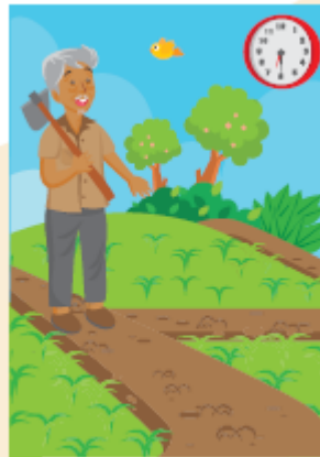
Grand father goes to the paddy field at 06.30 on foot.