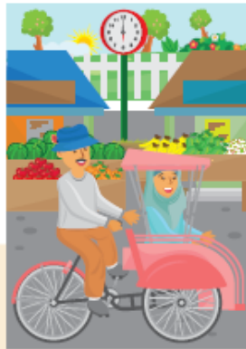
Mother goes to the market at 06.00 by pedicab.