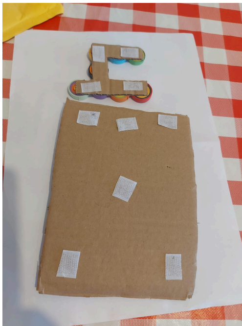
תמונות הצמדנים (סקוש / וולקרו)

האביזר צריך להיות קל משקל - כדי שיחזיק בקלות עם צמדן על הבובה ויהיה קל ללובש הבובה לרקוד עם הרבה אביזרים. האביזר צריך להיות חזק מספיק או מחוזק לדוגמא נייר מחוזק בסלוטפ , כדי שלא יקרע בהדבקתו לבובה האביזר צריך להיות בגובה של פחות מ5 סנטימטרים כדי שניתן יהיה לאחסנו , אחד על השני בהחלט ניתן להתייעץ עם העמותה ולהעלות רעיונות יצירתיים