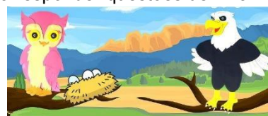
A CORUJA E A ÁGUIA

Texto 3 para responder questões de 11 a 15: