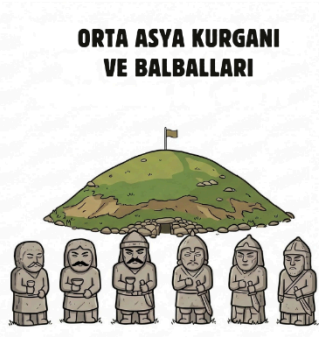
ORTA ASYA KURGANI VE BALBALLARI