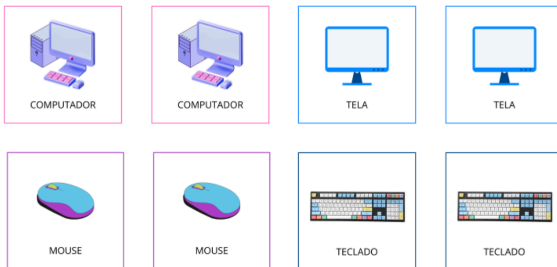
Imagem 2 - Amostra de algumas das cartas disponíveis no Jogo da Memória.