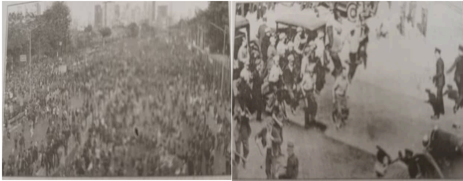
Gambar 1 Rusuhan Kaum 13 Mei 1969

4 Gambar 1 menunjukkan tragedi berdarah yang berlaku di negara kita.