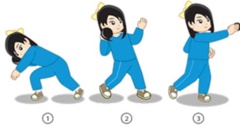
Gambar 1.3 Aktivitas pembelajaran sikap menolak peluru dari sikap badan menyamping