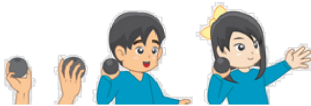
Gambar 1.2 Aktivitas pembelajaran Sikap badan dan letak peluru