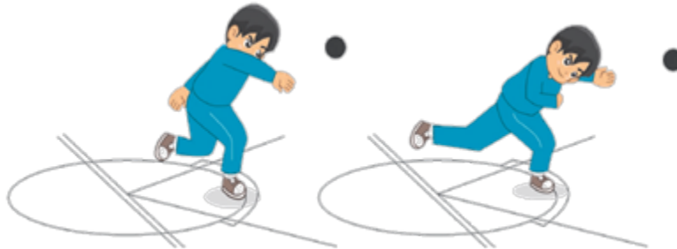
Gambar 1.3 Aktivitas pembelajaran sikap badan setelah menolak peluru

Cukup sekian dulu informasi yang bisa chentantris.blogspot.com berikan mengenai Macam-macam Gaya dan Prinsip dasar dalam Tolak Peluru, semoga bisa bermanfaat dan membantu anda yang membutuhkannya