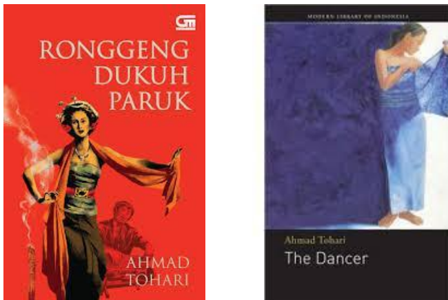
Gambar 1: Novel Ronggeng Dukuh Paruk dan The Dancer