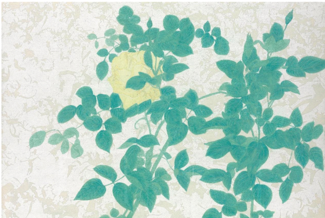
詹琇鈴 / 平凡生活的綠色 10 / 40x60 cm / 膠彩紙本 / 2022

開放時間 | 週二-週六 11:00-18:00 | https://www.keyuan.com.tw/