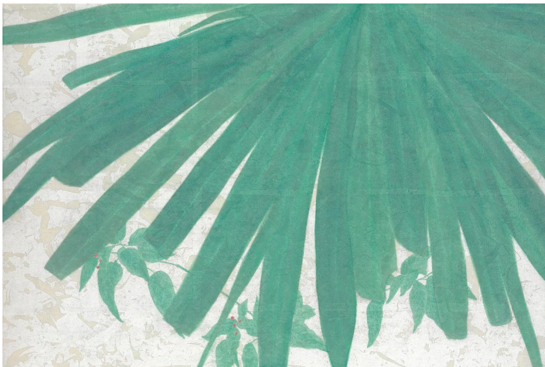
詹琇鈴 / 平凡生活的綠色 2 / 40x60 cm / 膠彩紙本 / 2022