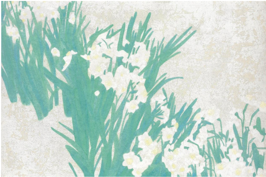
詹琇鈴 / 記憶與排列 3 / 40x60 cm / 膠彩紙本 / 2022