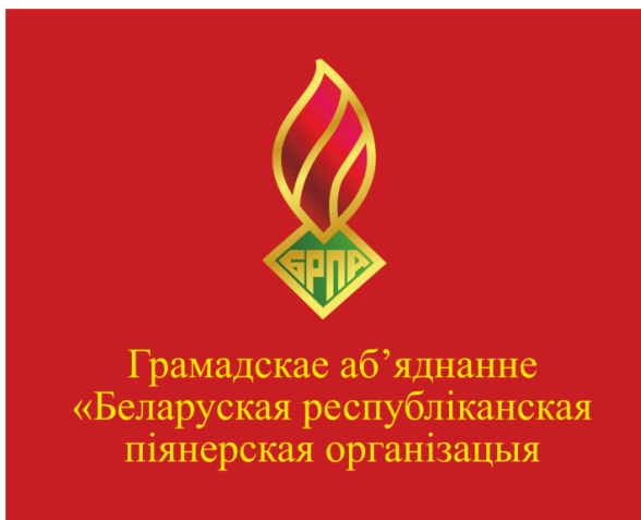
Знамя ОО «БРПО» (лицевая сторона)