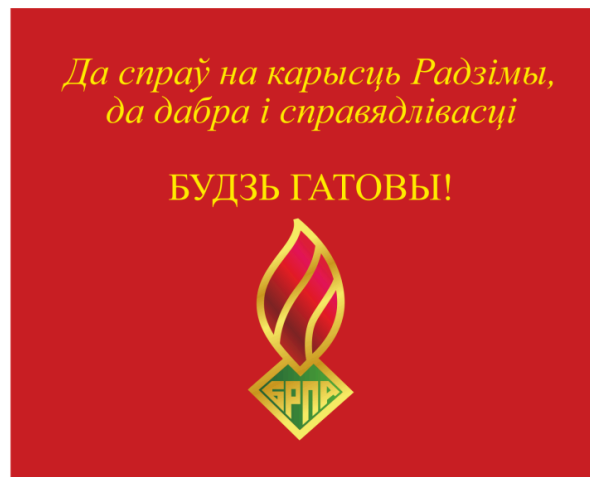
Знамя ОО «БРПО» (оборотная сторона)