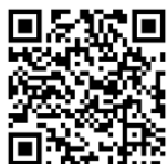
สื่อบทที่ 4