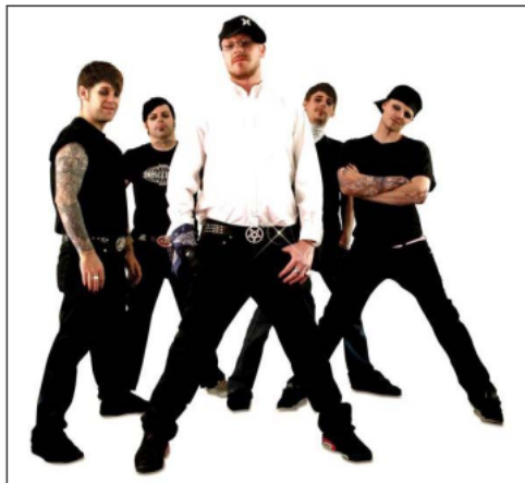
Gambar 2. Band Blood Duster ukuran 10.