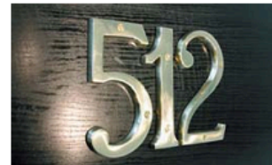
die Zimmernummer room number