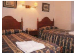
das Zweibettzimmer twin room