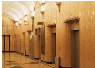
der Fahrstuhl elevator