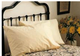
das Einzelzimmer single room