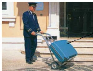
der Hoteldiener porter