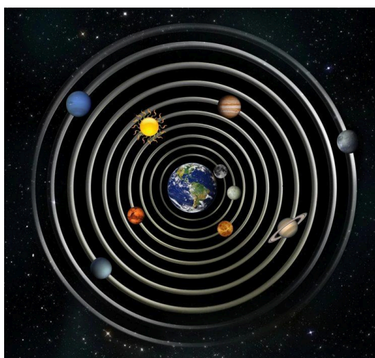
Рисунок 1 - Геоцентрическая модель Вселенной Птолемея

Огромную роль в развитии Астрономии сыграли две научные школы. Одна часть учёных считала центром Мироздания - Землю, и что все небесные объекты вращаются вокруг неё. Яркими представителями данной школы стали Аристотель, Гиппарх и самым известным - Птолемей. Именно он создал геоцентрическую модель Вселенной. В центре Вселенной Птолемей поместил шарообразную Землю, а Луну и Солнце водворил на концентрические круговые орбиты, общий центр которых совпадает с центром Земли (рис.1).