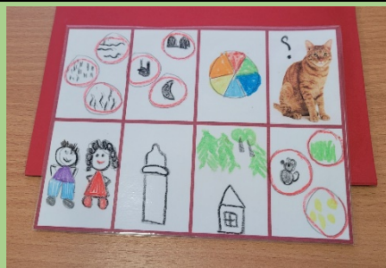
Домашние и дикие животные

Мешок с жетонами (красного, желтого и зеленого цвета) - 30 штук.