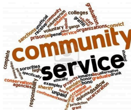
Gambar 1. Pengabdian Kepada Masyarakat

Gambar yang dicantumkan pada naskah harus dengan kualitas yang baik (tidak blur). Gambar tidak berdiri sendiri dan harus merupakan bagian yang relevan dari naskah [4]. Agar diperhatikan bahwa gambar bukan merupakan dokumentasi yang tidak terkait dengan pembahasan naskah. Pastikan naskah tidak menampilkan gambar yang menunjukkan identitas maupun afiliasi para penulis. Contoh peletakan serta penamaan gambar seperti pada Gambar 1, Gambar 2, dan contoh menampilkan diagram pada Gambar 3.