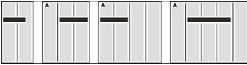
Рисунок 3 - Варианты размещения заголовка внутри текста

Не рекомендуется переносить в середину текста заголовок, формат которого равен общему формату статьи, так как он разобьет ее на две части. Заголовок не следует опускать ниже оптического центра заметки, иначе нарушатся ее пропорции. Установка заголовка внизу текста прием из журнальной верстки, пользоваться которым в газете не рекомендуется. И наконец, при любом перемещении заголовка вглубь текста желательно обозначить начало заметки с помощью буквицы.